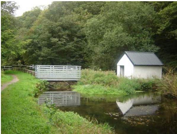
Adnewyddwyd cwt ceidwad y loc yn Ynysmeudwy ym 1985.

Mae llawer o bobl yn mwynhau beicio a cherdded ar hyd llwybr halio'r gamlas. Mae grwpiau bywyd gwyllt ac ysgolion lleol yn ymweld â'r gamlas i fwynhau'r anifeiliaid a'r planhigion di-ri sydd yno.