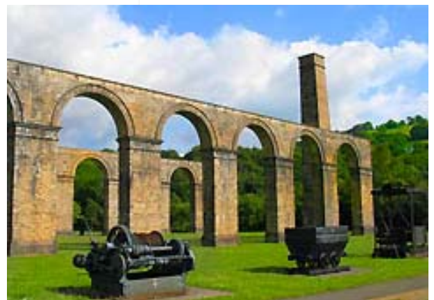
Crëwyd parc Gweithfeydd Haearn Ynyscedwyn ar safle'r hen weithfeydd haearn.