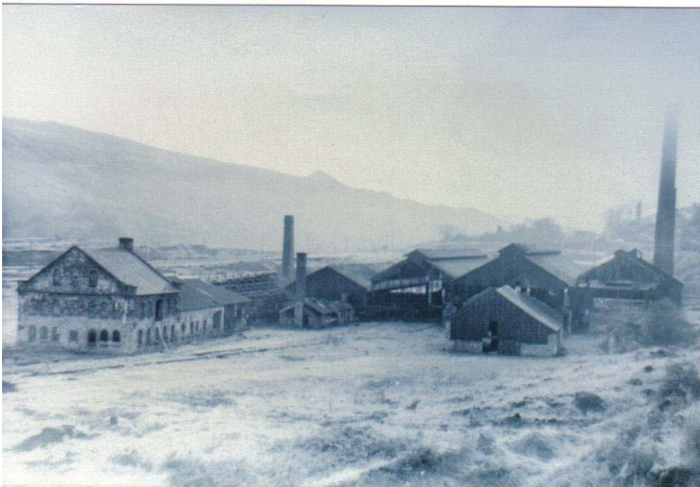
Gweithfeydd Tunplat Ystalyfera

Ffynnodd Cwm Tawe isaf yn sgil twf y diwydiannau copr, a gyfrannodd yn aruthrol at gyfoeth Abertawe a'r trefi cyfagos.