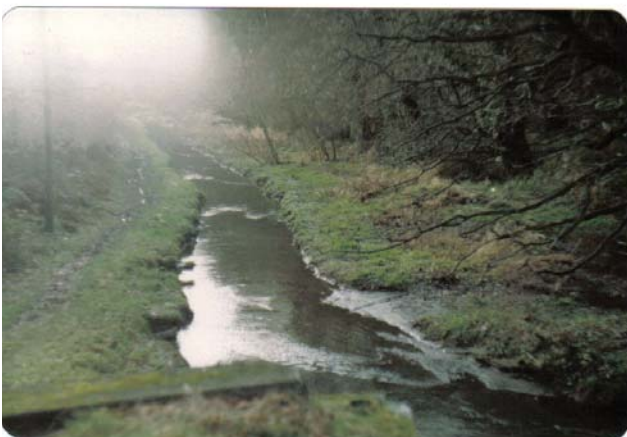
Darn adfeiliedig o Gamlas Abertawe

Dechreuodd sawl rhan o'r gamlas adfeilio a chafodd rhannau eraill eu llenwi gan adael dim ond 5 milltir o'r gamlas â dŵr. Fe adeiladwyd ffordd newydd ar lwybr y gamlas yn Ystradgynlais ac Abertawe hyd yn oed.